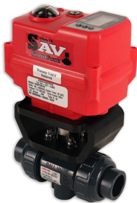
Válvulas de Esfera Tripartidas Tipo-21/21a SST Tamanhos: 1/2" - 4"

Os atuadores elétricos Série 19 SAV Smart Pack® podem ser montados de fábrica em válvulas de esfera SST Tipo-21/21a e Tipo-21a, válvulas de esfera Tipo-23 Multiport™ e válvulas borboleta da série Tipo-57. Escolha entre válvulas de PVC, CPVC, PP e PVDF e conectores de soquete ou de extremidades roscadas (válvulas de esfera). Um só código de identificação para conjuntos de válvulas e atuadores facilita a seleção do conjunto desejado. Todos os conjuntos Smart Packs® estão disponíveis em quatro modelos diferentes: abrir/fechar, controle, à prova de falhas e controle à prova de falhas.