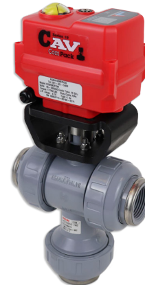
Válvulas de Esfera Tipo-23 Multiport™ Tamanhos: 1/2" - 2"