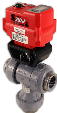
Válvulas de Esfera Tipo-23 Multiport™ Tamanhos: 1/2" - 4"