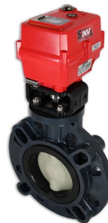
Válvulas Borboleta Tipo-57P Tamanhos: 1-1/2" - 10"

Para diagramas de fiação e outros documentos técnicos, visite nosso site.