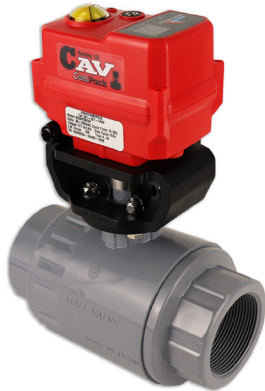
Válvulas de Esfera Tipo-27 Omni® Tamanhos: 3/8" - 2"