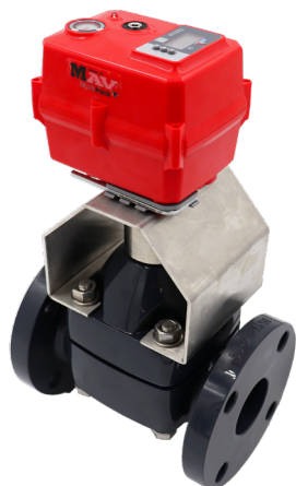
Válvulas de Diafragma Tipo-14 Tamanhos: 1/2" - 4"