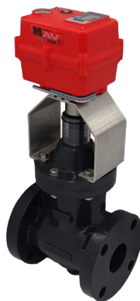
Válvulas Gaveta Tipo-C Tamanhos: 1-1/2" - 4"