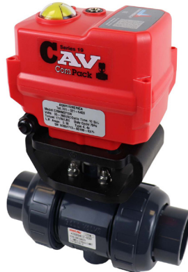
Válvulas de Esfera Tipo 21/21a Tamanhos: 1/2" - 2"